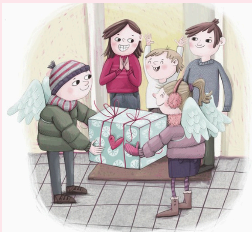
Ilustracija: Ana Razpotnik Donati

Veseli smo, da si se nam pridružil. Prepričani smo, da bomo skupaj ustvarili ogromno čudovitih daril, ki bodo na obraze otrok po Sloveniji narisala široke nasmehi.